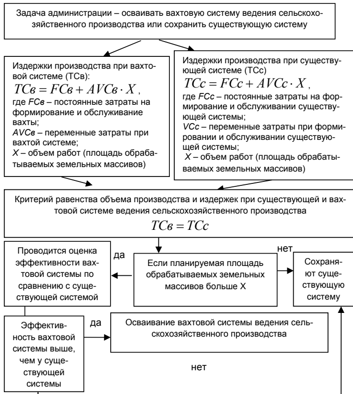
Рис. 4. Алгоритм определения целесообразности освоения вахтовой системы в сельскохозяйственной организации

ющей и вахтовой системы. Общие издержки при вахтовой системе ведения производства представляют собой сумму производственных, капитальных и текущих затрат на содержание вахтового стана.