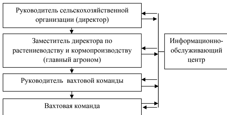
Рис. 2. Субъекты управления вахтовой системой

Ввиду того, что многие сельскохозяйственные организации Новосибирской области находятся в затруднительном финансовом положении, при переходе на вахтовую систему ведения сельскохозяйственного производства, требующую дополнительных финансовых вложений, нецелесообразно создавать специальные управляющие отделы. Решение основных организационных и производственных вопросов находится в компетенции заместителя директора по растениеводству и кормопроизводству, ему непосредственно подчиняется руководитель вахтовой команды, который несет ответственность за сроки и качество выполняемых работ, доставку работников на вахтовый стан и обратно, бытовые условия, производственную дисциплину на основании предварительно заключенного договора. Решение о переходе на вахтовую систему ведения сельскохозяйственного производства принимается руководителем сельскохозяйственной организации. Если для формирования вахтовых команд привлекаются работники, постоянно проживающие за пределами муниципального образования, решение согласовывается с главой местного самоуправления того муниципального образования, куда привлекается рабочая сила.