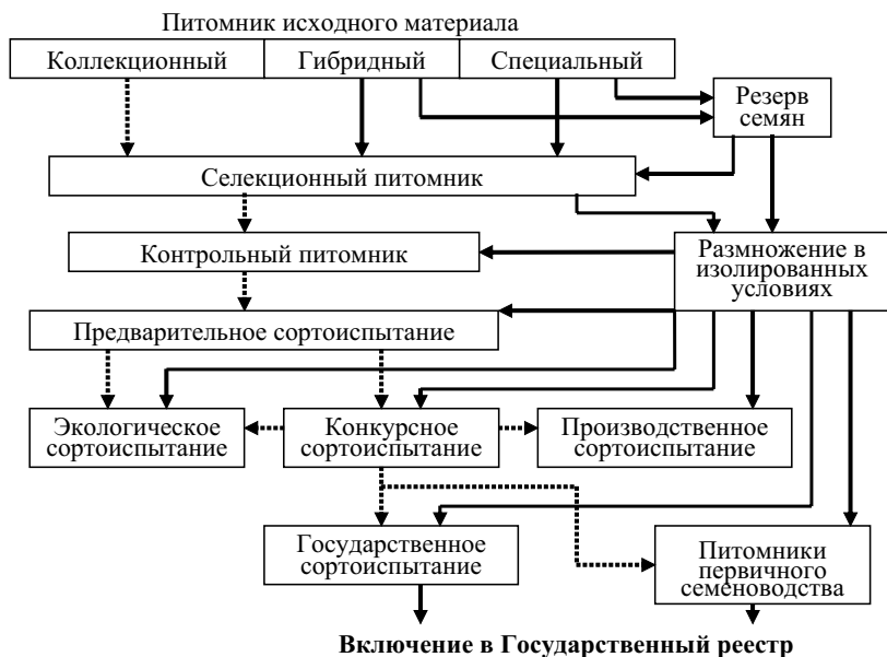
Рис. 4. Схема селекционной работы с перекрёстноопыляющимися культурами (последовательность питомников показана пунктирными стрелками)

расстояниях друг от друга, что затрудняет проведение всех необходимых работ в течение лета. В связи с этим селекционную работу перекрестноопыляющихся культур следует хорошо продумывать и тщательно планировать, а объем материала должен быть посильным.