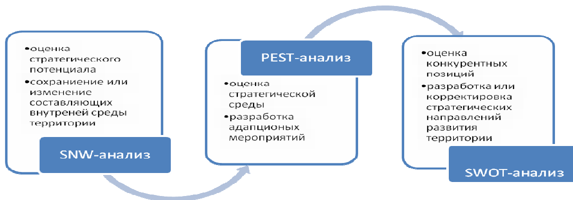
Рисунок 1 – Системный подход к оценке конкурентных позиций сельских территорий

Обоснована необходимость и значимость внедрения в практику муниципального управления технологий диагностики конкурентных позиций и оценки конкурентоспособности территорий на базе стратегического анализа. При анализе особенностей развития территории Чилинского сельского поселения и оценке его территориальных конкурентных позиций автором использован инструментарий территориального маркетинга. Методическую основу инструментария составили SNW-анализ, PEST-анализ, SWOT-анализ. Использован системный подход к оценке конкурентных позиций сельских территорий (рисунок 1).