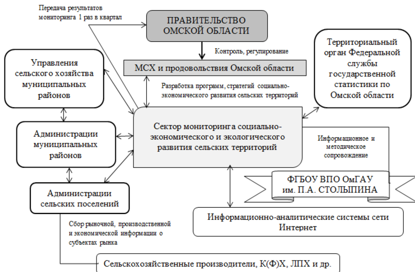
Рисунок 2 – Взаимодействие сектора мониторинга социально-экономического и экологического развития сельских территорий с институтами рыночной инфраструктуры

и финансового оздоровления при Министерстве сельского хозяйства и продовольствия Омской области, осуществляется его информационное и методическое сопровождение.