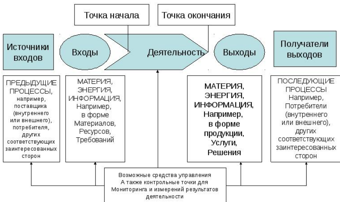
Рис. 3 Схематичное изображение элементов процесса

Выбрать любой вид продукции. Определить основные бизнес-процессы создания продукции и к одному (по выбору) применить процессный подход в виде карты процесса по схеме, отраженной на рис. 1. Учесть в работе использование цикла PDCA.