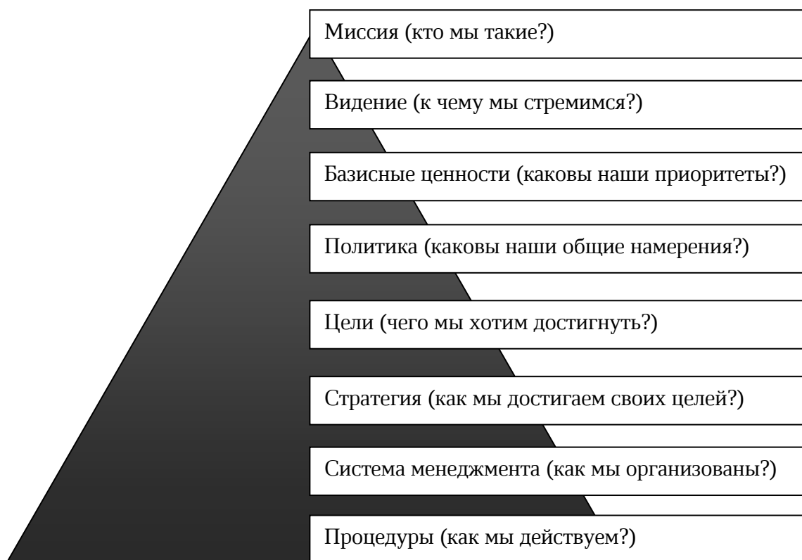
Рис. 1 Иерархия уровней стратегических решений менеджмента организации