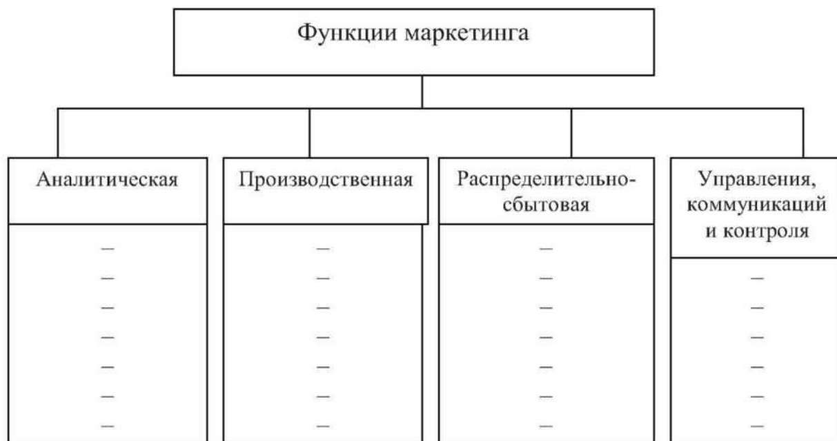
Рисунок 1 - Функции маркетинга

Впишите под каждой функцией маркетинга соответствующие виды маркетинговой деятельности, заполнив рисунок 1: