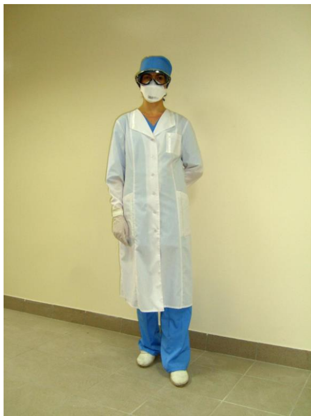
Рисунок 5 – Защитная одежда для работы в боксе биобезопасности 2 класса