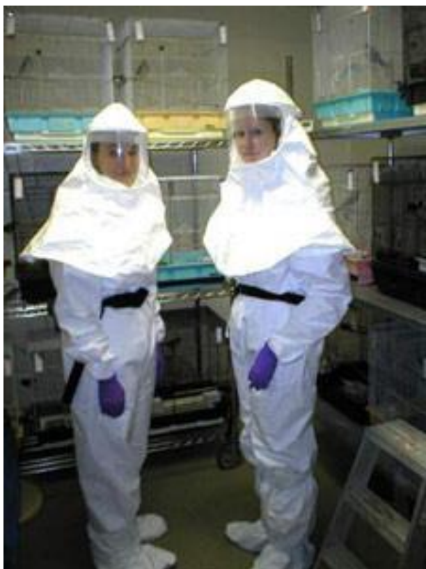
Рисунок 4 – Первичные барьеры (защитная одежда) для уровня BSL-4

2) второй класс – средства индивидуальной защиты сложной конструкции, защищающие от гибели или от опасностей, которые могут причинить необратимый вред здоровью пользователя, которые подлежат обязательной сертификации.