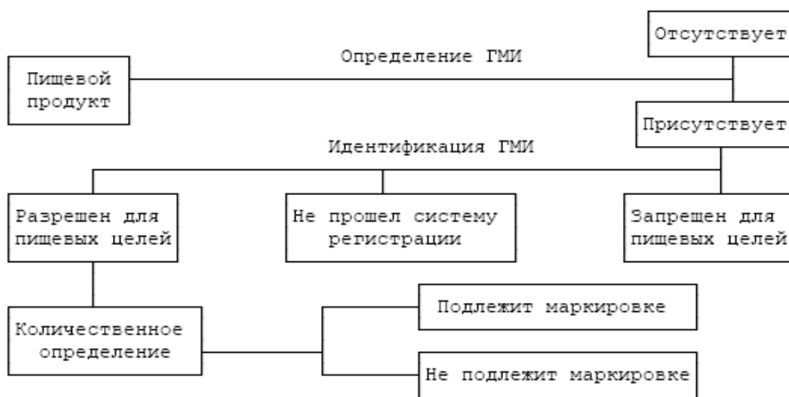
Рисунок 1 – Схема идентификации ГМИ в пищевых продуктах

В 2000 г. разработаны и утверждены методические указания «Медико-биологическая оценка пищевой продукции из генетически модифицированных источников». В них установлен порядок гигиенической экспертизы и государственной регистрации пищевой продукции, полученной из генетически модифицированных источников (рис. 1). Утверждены методики медико-гигиенической, медико-биологической оценки и клинических испытаний всех видов пищевой продукции, полученной с помощью ГМО.