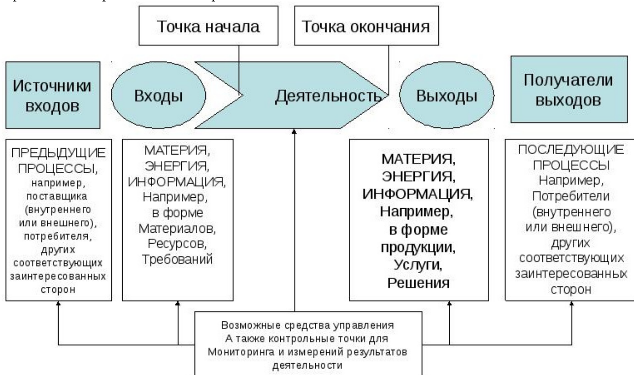
Рис. 3 Схематичное изображение элементов процесса

Выбрать любой вид продукции. Определить основные бизнес-процессы создания продукции и к одному (по выбору) применить процессный подход в виде карты процесса по схеме, отраженной на рис. 1. Учесть в работе использование цикла PDCA.