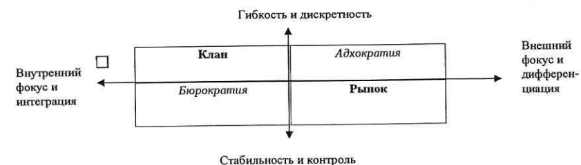
Рис. 1. Модель рамочной конструкции конкурирующих ценностей и соответствующих типов организационной культуры

- второе измерение отделяет критерии эффективности, которые подчеркивают внутреннюю ориентацию, интеграцию и единство, от критериев, ассоциируемых с внешней ориентацией, дифференциацией и соперничеством. Границы этого измерения простираются от организационной сплоченности и согласованности на одном краю до организационной разобщенности на другом