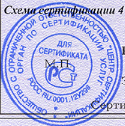
Схема сертификации 4

НА ОСНОВАНИИ Акта оценки оказания услуг питания столовой №31 от 18 октября 2010 г. Санитарно-эпидемиологического заключения №42.21.02.000.М.001202.10.07 от 26.10.2007 г., выданного Управлением Роспотребнадзора по Кемеровской области. Протоколов испытания готовой продукции пищблока №№ 7096, 7098-7102 от 12.10.2010 г., №№ 355-356 от 15.10.2010 г., выполненных аккредитованным испытательным лабораторным центром ФГУЗ «Центр гигиены и эпидемиологии в Кемеровской области», аттестат аккредитации № РОСС RU.0001.510238 от 26.03.2009 года.