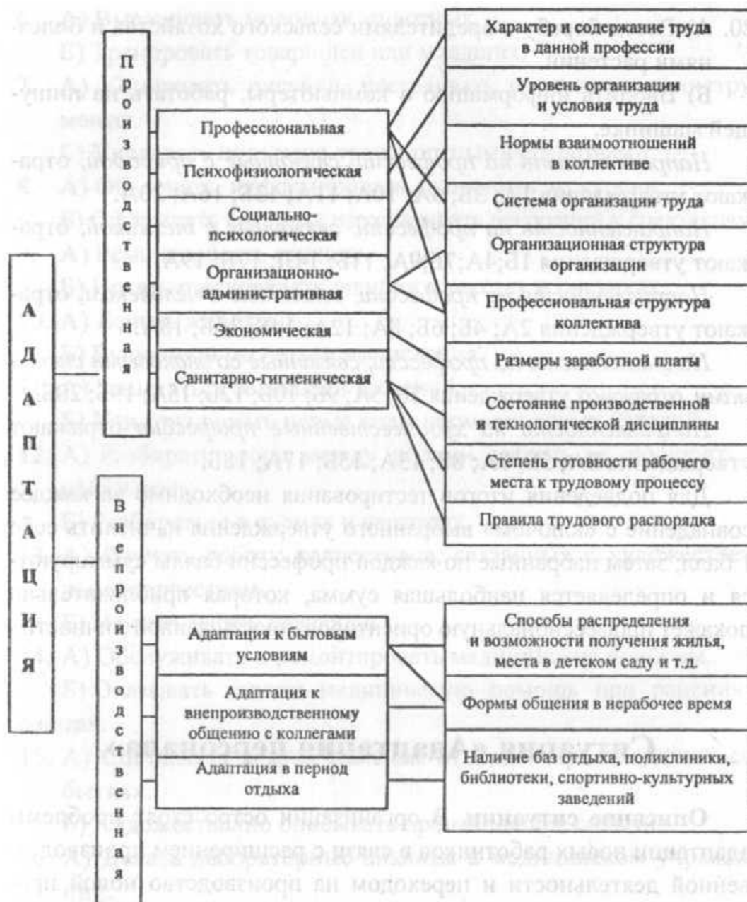
Рис. 1. Виды адаптации и факторы, на нее влияющие