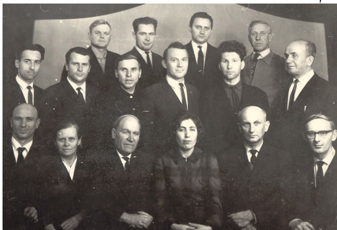
На фото: коллектив кафедры тракторов и автомобилей, победитель социалистического соревнования. Фотография размещалась на Доске почёта НСХИ.