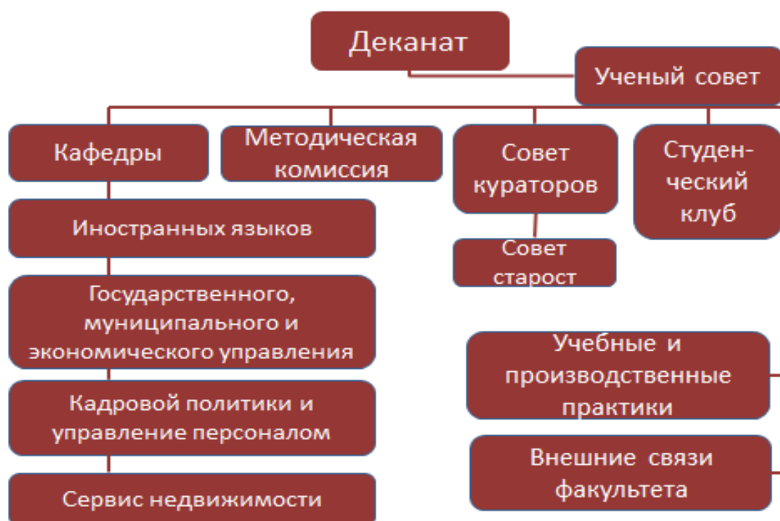
Рис. 1. Структура и органы управления факультета ГМУ

Общее руководство факультета осуществляет Ученый Совет. Избрание членов Ученого Совета, декана, сроки полномочий и условие их прекращения определено уставом университета. Состав Ученого Совета – 18 человек.